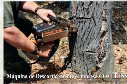
Máquina de Descortiçamento Empresa COVELESS