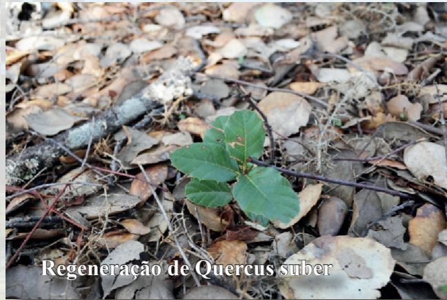
Regeneração de Quercus suber

2 Práticas Silvícolas para a Gestão Sustentável (Operações Florestais; Modelos de Silvicultura orientados para os objetivos pretendidos; Aproveitamento silvopastoril; Defesa da Floresta Contra Incêndios e gestão de povoamentos ardidos; Novas tecnologias ligadas ao descortiçamento)